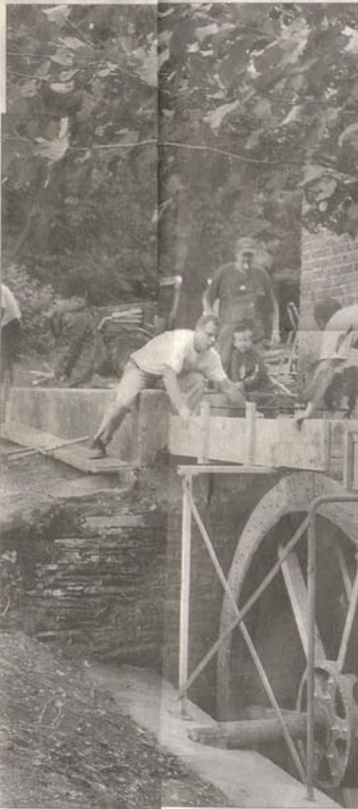
Nach dem Einbau des neuen Rades musste noch der Zulauf auf das Rad reguliert werden.

So wurden im Hunsrück die Mühle in Niederkumbd und die Bergmühle in Horbruch von Vankorb restauriert. Selbst im luxemburgischen Munshausen wurde eine Museumsmühle vollständig von den Lauferweiler „Mühlärzten“ wieder aufgebaut. Neben der Gösenrother Mühle arbeitet Vankorb derzeit auch an Mühlen in Schifferstadt und Völklingen.